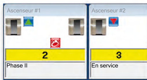
Vue compressée optionnelle